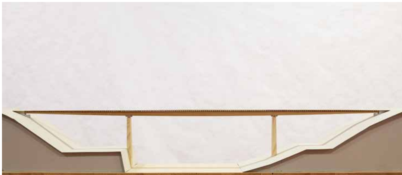
Concours Bannauer Steg: maquette réalisée par Lydia Conzett-Gehring, 2004, Conzett Bronzini Partner AG.

Je considère cette documentation comme un cadeau généreux pour tous ceux qui aiment notre profession, ainsi qu'un outil de