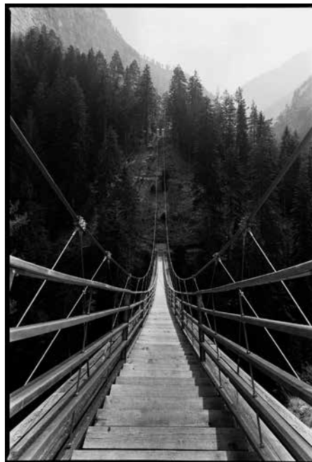
Seconde passerelle de Traversina, Viamala, 2005, Conzett Bronzini Partner AG

EXPOSITION LANDSCAPE AND STRUCTURES Un inventaire personnel de Jürg Conzett, photographié par Martin Linsi, avec 22 maquettes de Lydia Conzett-Gehring Teatro dell'architettura, Mendrisio arc.usi.ch/it/news/detail/28016