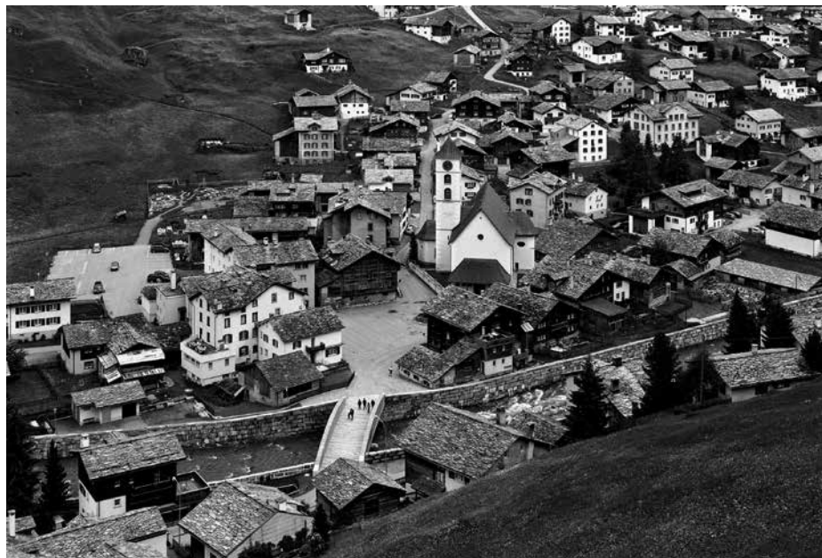
Ponte della piazza, Vals, 2010, Conzett Bronzini Partner AG et Peter Zumthor