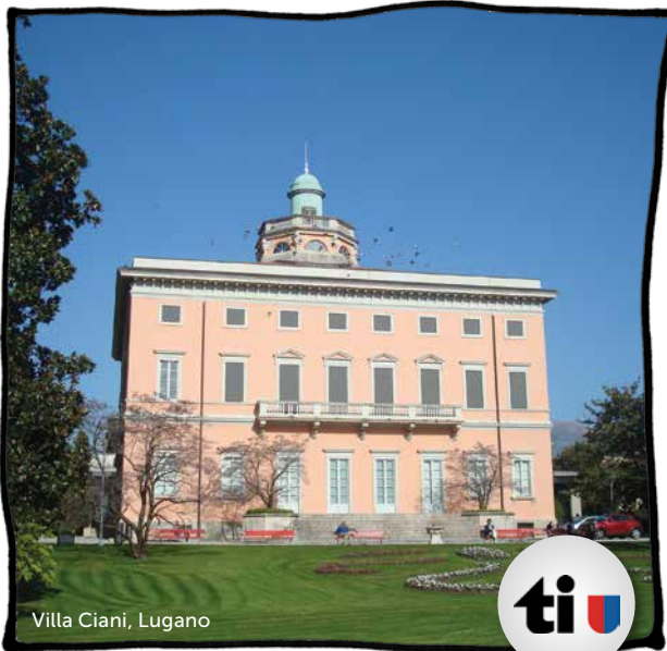
Villa Ciani, Lugano